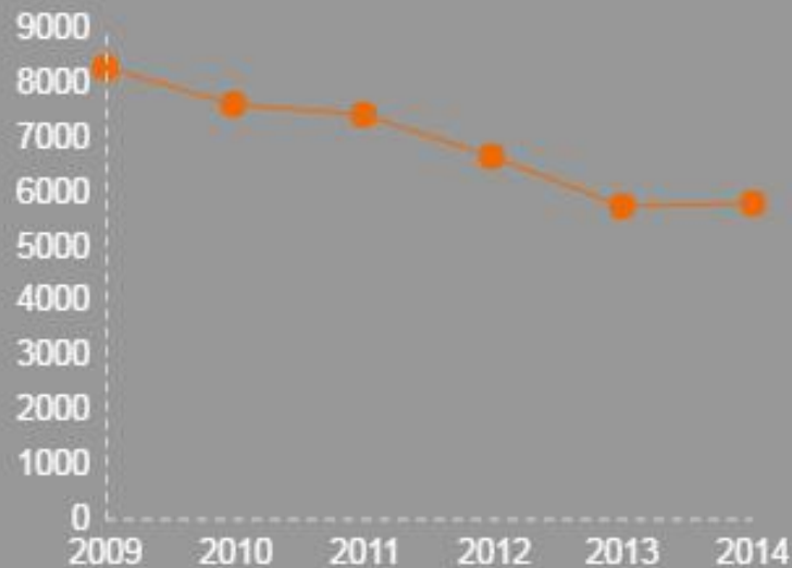
Evolution de l'emploi salarié

La région souffre des restructurations de la VAD traditionnelle (La Redoute et 3 Suisses en particulier).